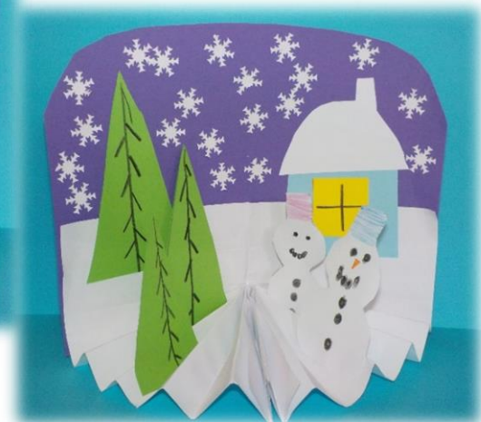
Kludia K. (2.ročník)