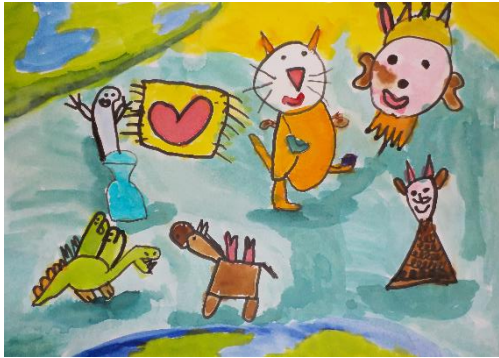
Filip T. (1.ročník)