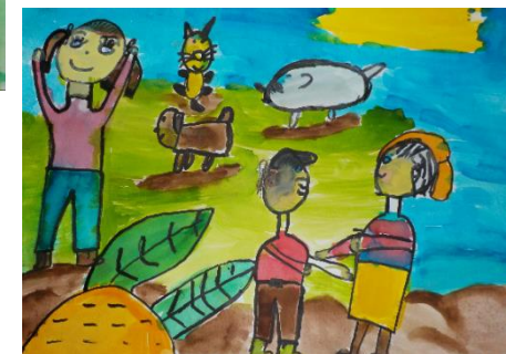
Kludia K. (2.ročník)