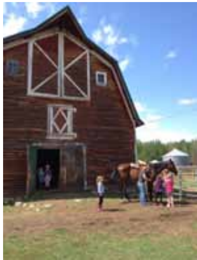
1. One of the many old farm barns.