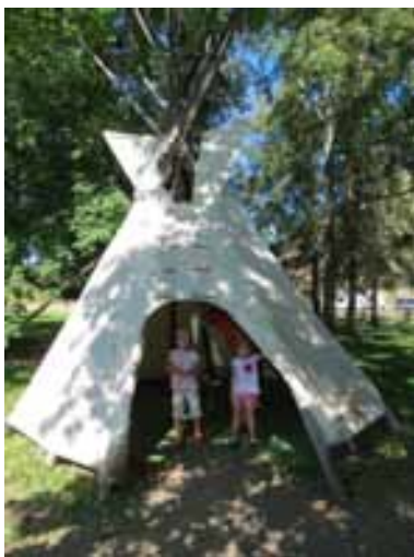
2. A Tipi - the First Nations shelter traditionally made of animal skins.