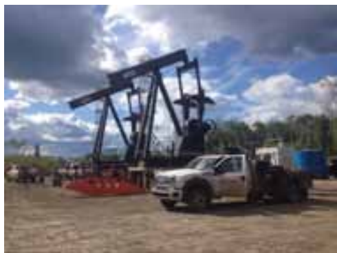
3. Oil industry brings newcomers to rande Prairie every day.